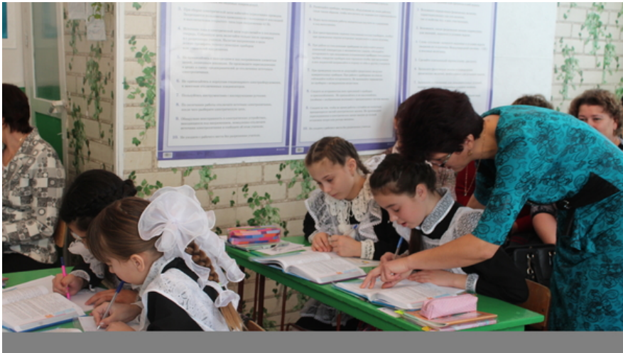
Районное МО учителей математики.