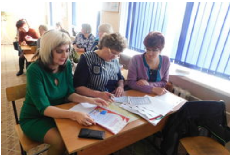
районного научно-практической конференции по математике